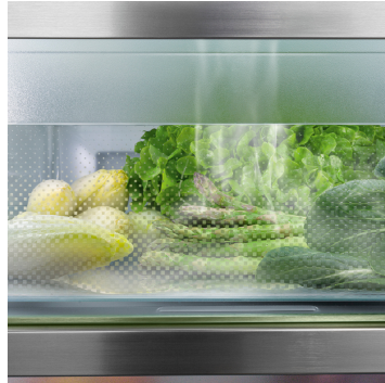
BioFresh mit HydroBreeze

Der BioFresh Professional-Safe verleiht Lebensmitteln einen zusätzlichen Frische-Kick für maximale Haltbarkeit – Wow-Effekt inklusive: Dank HydroBreeze breitet sich ein kühler Nebel wie Balsam über das frische Obst und Gemüse aus. In Kombination mit einer Temperatur knapp über 0 °C und hoher Luftfeuchtigkeit fühlen sich unverpackte Obst- und Gemüsesorten besonders wohl.