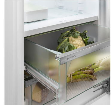
Fruit & Vegetable-Safe

Sie möchten Obst und Gemüse kühlen wie Profis? HydroBreeze wird Sie begeistern: Der kalte Nebel, verbunden mit der Temperatur im Safe knapp über 0 °C, gibt Lebensmitteln den Extra-Kick für längere Haltbarkeit. Und er sorgt für einen optischen Wow-Effekt. HydroBreeze aktiviert sich alle 90 Minuten für 4 Sekunden und für 8 Sekunden bei Türöffnung.