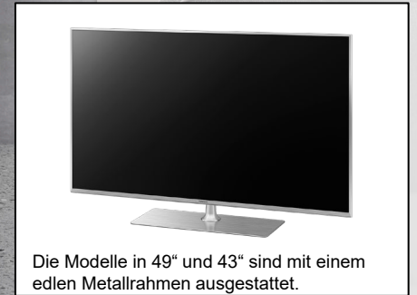
Die Modelle in 49" und 43" sind mit einem edlen Metallrahmen ausgestattet.