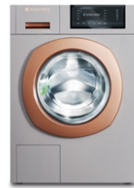
Ever Rose 8520.2U2