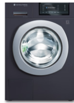
Titan Rock 8520.2U3