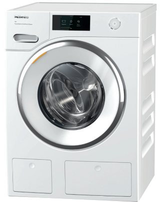
Passender Trockner: TWR 700-80 CH