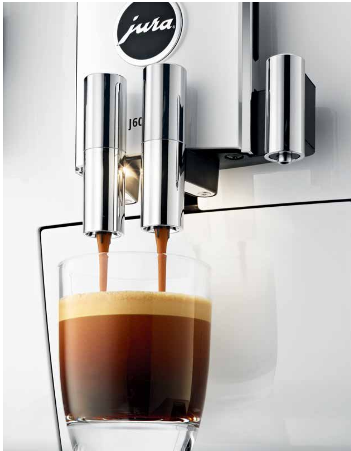
J600 von JURA 360° Hochgenuss für alle Sinne